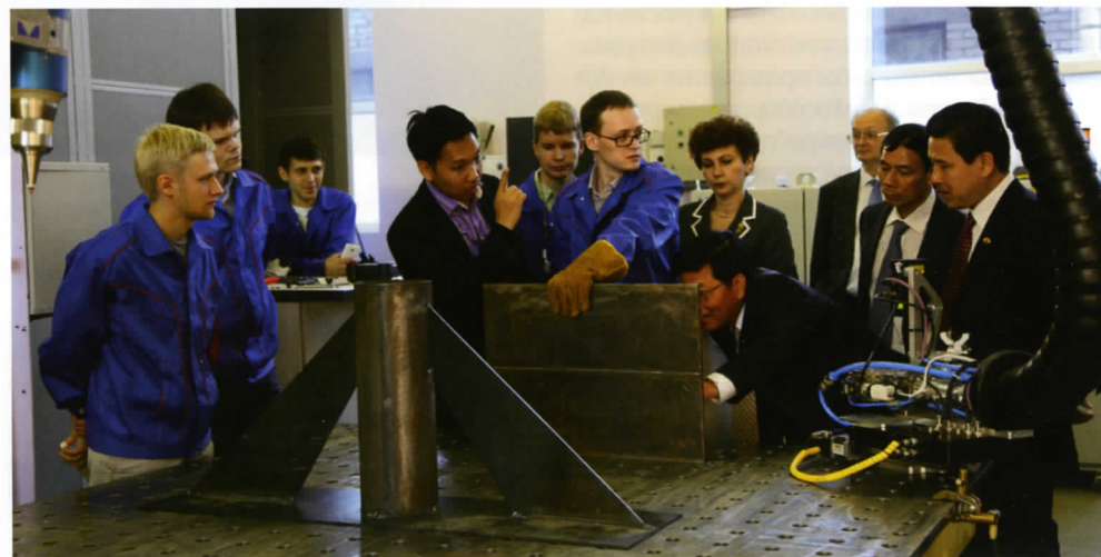
Делегация Социалистической Республики Вьетнам в АО «ЦТСС»