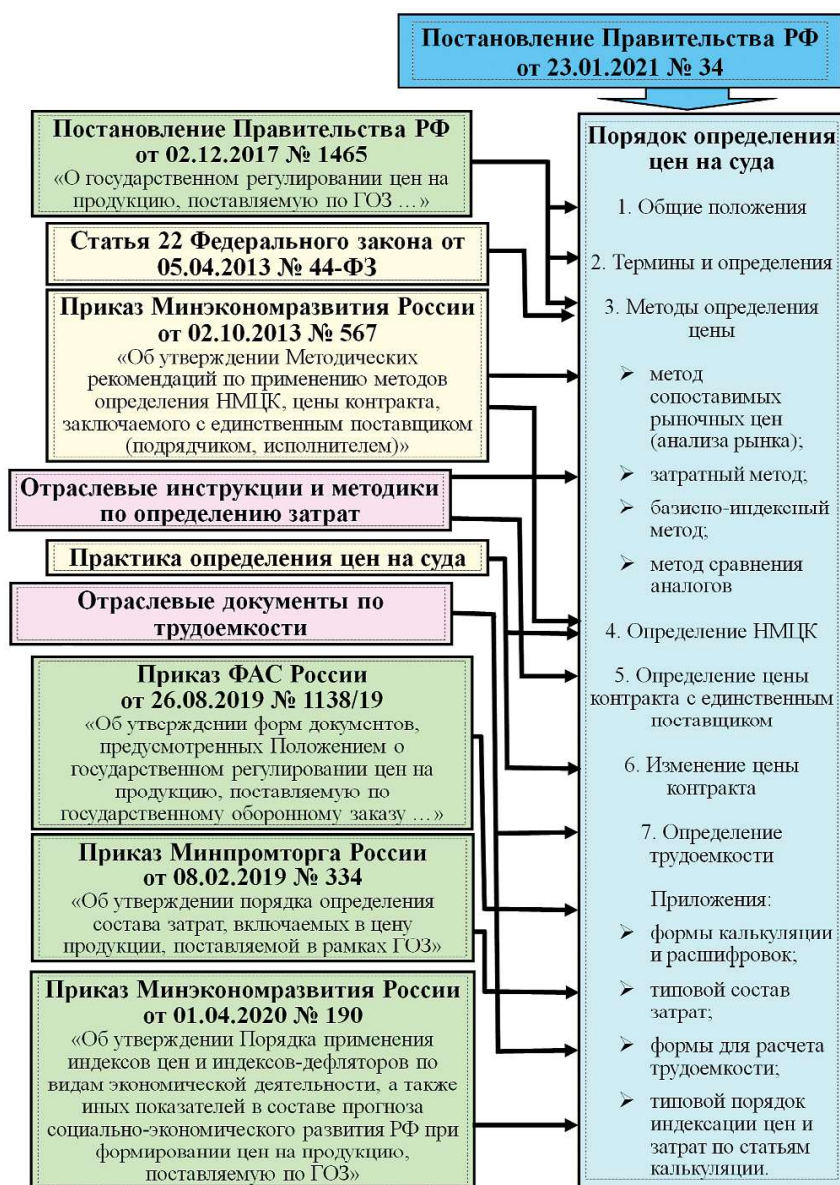
Рис. 1. Предлагаемая структура Порядка определения цен судов

Следует отметить, что отраслевые инструкции и методики по ценообразованию [4, 5] и сегодня с учетом норм действующего законодательства используются при разработке расчетно-калькуляционных материалов (РКМ) для строительства судов. При этом необходимо отметить, что в соответствии с письмом Минфина России от 29.04.2002 г. № 16-00-13/03 [6] до завершения работы по разработке и утверждению министерствами и ведомствами соответствующих отраслевых нормативных документов по вопросам организации учета затрат на производство и калькулирования себестоимости продукции (работ, услуг) организациям, как и